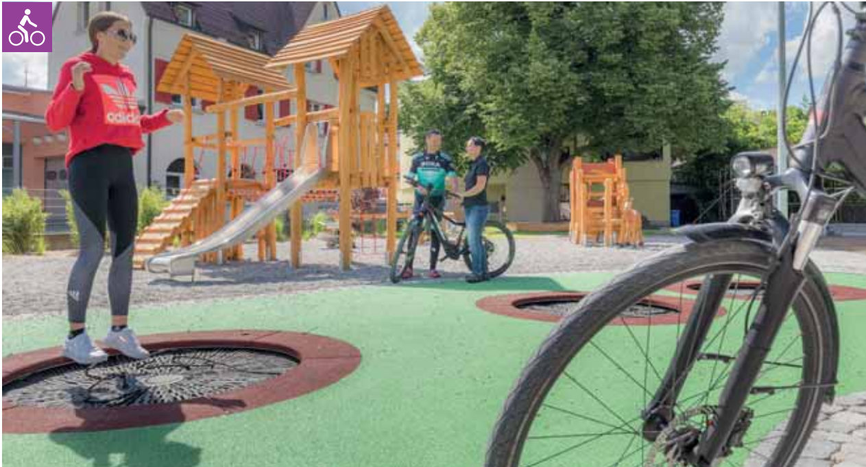
Spielplatz Schillergarten